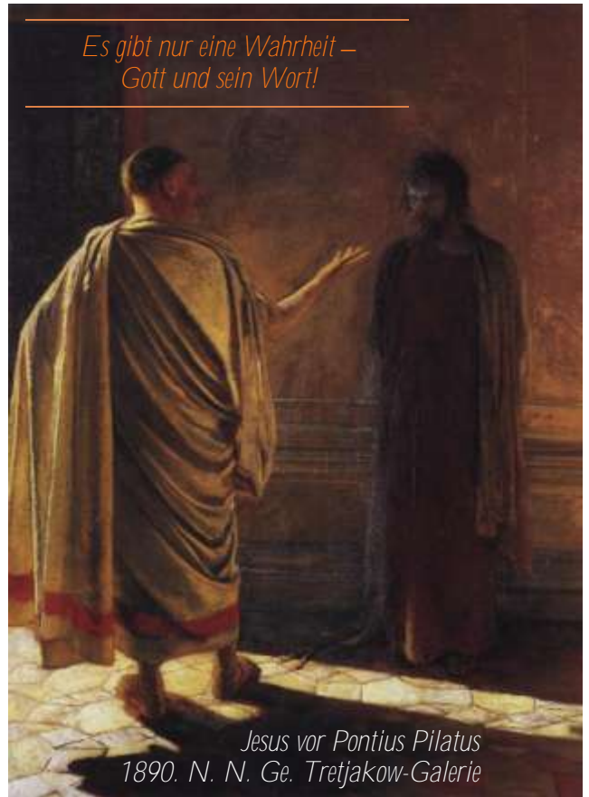
Jesus vor Pontius Pilatus 1890. N. N. Ge. Tretjakow-Galerie

Es gibt nur eine Wahrheit – Gott und sein Wort!