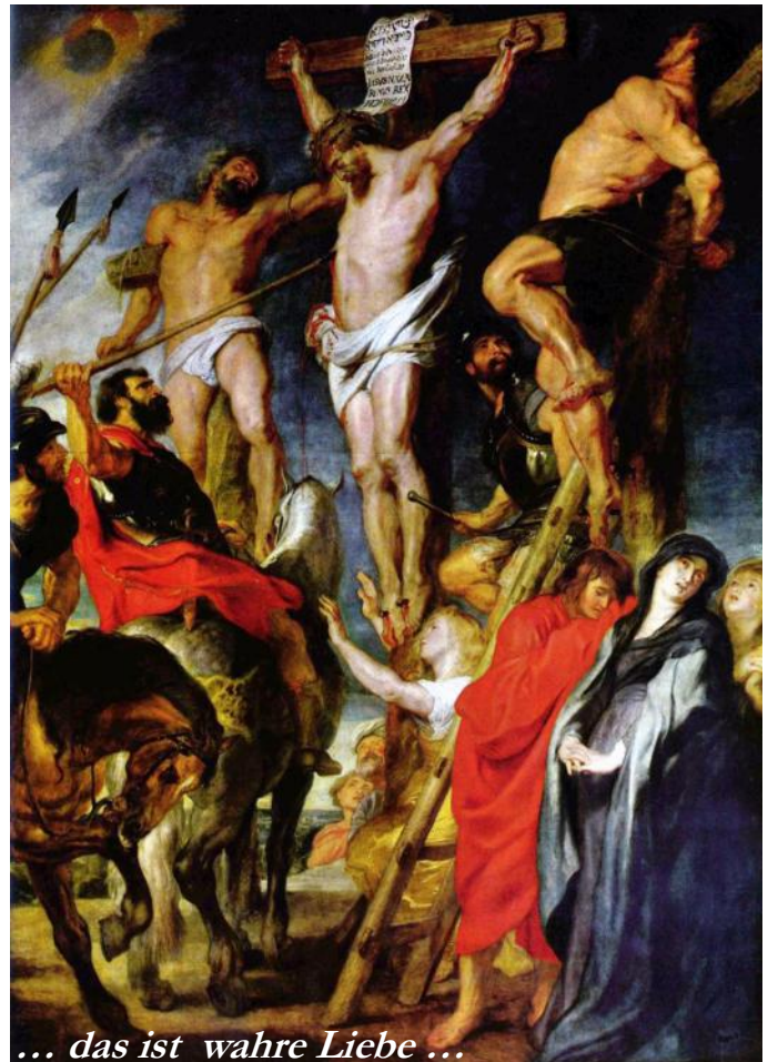
... das ist wahre Liebe ...

Wer mittels Liebesentzug disziplinieren will, muss stets damit rechnen, dass er Aggressionen auslöst. Es hilft nichts hinterher zu sagen: Ich habe ihm doch nichts getan! Jeder Liebesentzug ist ein Anschlag