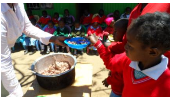
Leckeres Mittagessen für die Kids