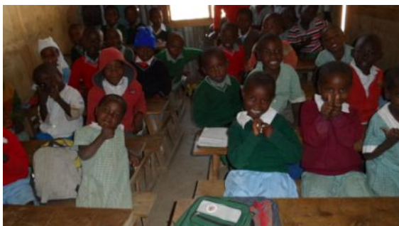
Eine fröhliche Schulklasse