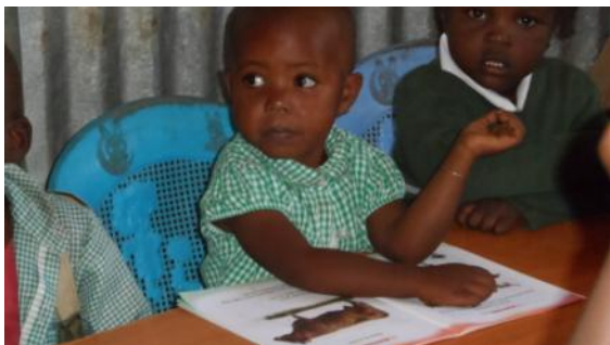
An den Lippen des Lehrers hängend