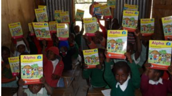
Die Vorschulklasse im Besitz der neuen Hefte