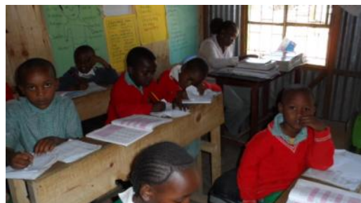
Die 2. Klasse bei der Stillarbeit