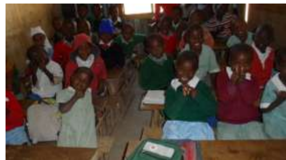
Eine fröhliche Schulklasse