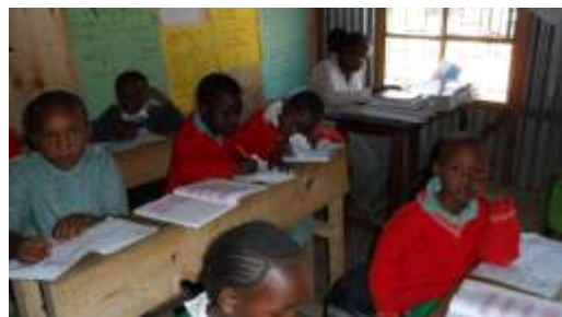
Die 2. Klasse bei der Stillarbeit