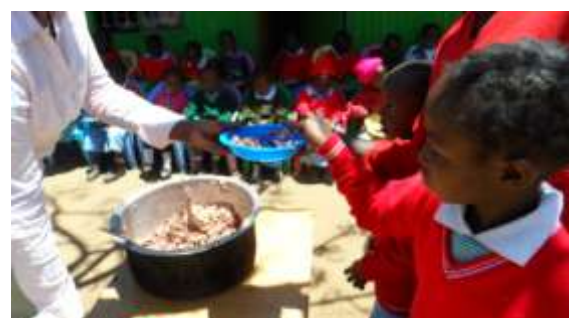
Leckeres Mittagessen für die Kids