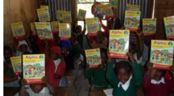
Die Vorschulklasse im Besitz der neuen Hefte