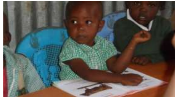
An den Lippen des Lehrers hängend