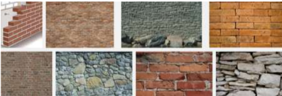
Beispiel, wie aus unterschiedlichsten Steinen, die zur Verfügung stehen, ein Bauwerk entsteht.