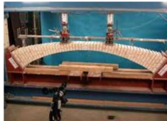
Beispiel wie selbst bei schwierigsten Konstruktionen ein Stein den anderen trägt und gemeinsam ein wunderbares Bauwerk entstehen kann

Jesus ist das Fundament auf dem das ganze Bauwerk, aber auch jeder einzelne steht. Er alleine gibt Antwort auf die Fragen der Gegenwart, er alleine hilft uns das Feuer der Vergangenheit zu bewahren und nicht die Asche zu hüten.