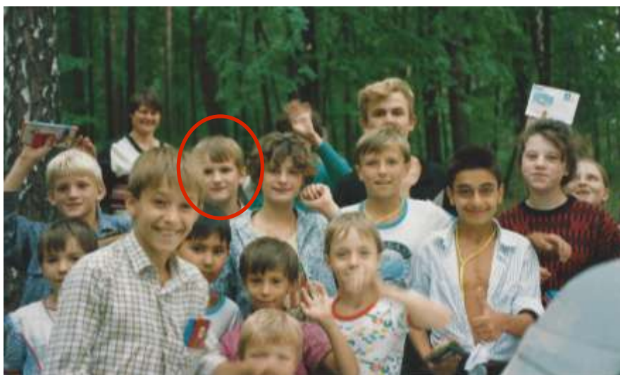
Waisenkinder aus dem russischen Internat in Obninsk freuen sich über kleine Geschenke aus Deutschland, Foto aus dem Sommer 1992