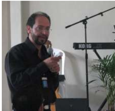
Jesus mein persönlicher Herr

Röm. 6,23. Gott dagegen macht uns ein unverdientes Geschenk: durch Jesus Christus, unseren Herrn schenkt er uns ein Leben, das keinen Tod mehr kennt. So nahm Jesus meine Schuld auf sich und gab mir ewiges Leben.